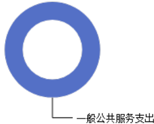
一般公共预算当年拨款结构图

2023年度一般公共预算当年拨款655.99万元，主要用于以下方面：一般公共服务支出655.99万元，占100.00%。